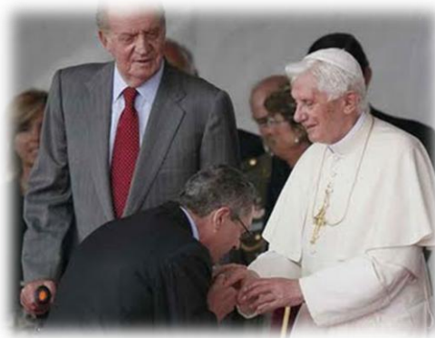
¿SUCESOR DE PEDRO?, NO LO ADORES, PUES, ES UN HOMBRE, ADORA A DIOS

2131 Fundándose en el misterio del Verbo encarnado, el séptimo Concilio ecuménico (celebrado en Nicea en 787), JUSTIFICÓ contra los iconoclastas EL CULTO de las imágenes: las de Cristo, pero también las de la Madre de Dios, de los ángeles y de todos los santos. Encarnándose, el Hijo de Dios inauguró una nueva "economía" de las imágenes.